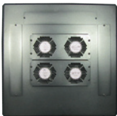
Exemple de mise en situation de 2 unités de ventilateurs 71624 sur la référence 71512.

Ces unités de ventilateurs ont la particularité de s'encastrer les unes dans les autres par l'intermédiaire des prises C13 et C14. Ainsi il est possible d'additionner plusieurs unités de ventilateurs ce qui permet ainsi d'augmenter de manière significative le refroidissement des baies informatiques.