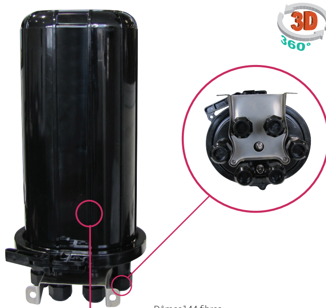
Dômes 144 fibres