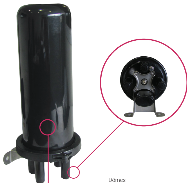
Dômes 48 - 72 - 96 fibres