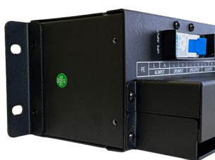
équerre position murale