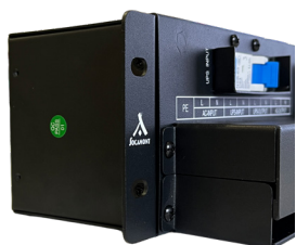
équerre position rack 19"