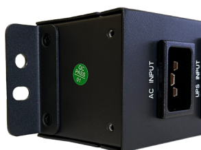
équerre position murale