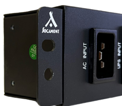
équerre position rack 19"